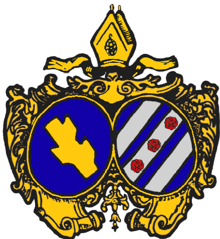
Benediktinské opatství sv. Václava v Broumově